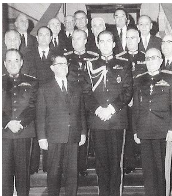
Κορὸς Γρεκίας Κωνσταντίν Β (на снимке справа – в сопровождении участников хунты)

Δυστυχώς οι εγγενείς αδυναμίες των ελληνικών πολιτικών κομμάτων, τα οποία στηρίζονταν περισσότερο στην ακτινοβολία μιας ορισμένης χαρισματικής πολιτικής προσωπικότητας (Νικόλαος Πλαστήρας – Εθνική Πολιτική Ένωση Κέντρου, Αλέξανδρος Παπάγος – Ελληνικός Συναγερμός, Κωνσταντίνος Καραμανλής – Εθνική Ριζοσπαστική Ένωση, Γεώργιος Παπανδρέου – Ένωση Κέντρου) και όχι σε συγκεκριμένες αρχές και η συνεχής επέμβαση της Αυλής στην πολιτική ζωή της χώρας, δεν επέτρεψαν την ομαλή λειτουργία του δημοκρατικού πολιτεύματος. Οι βασιλείς Παύλος (1947-1964) και Κωνσταντίνος ο Β' (1964-1967) προσπάθησαν να υποκαταστήσουν τα κόμματα, να κατευθύνουν αυτοί, σύμφωνα με τις