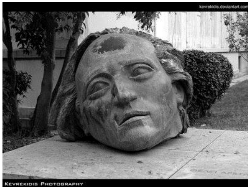
Памятник жертвам восстания студентов Политехнического института

ГРЕЧЕСКИЙ КУЛЬТУРНЫЙ ЦЕНТР 127566 Москва, Алтуфьевское шоссе, 44 офис № 9, 2 этаж Тел.: 7084809 – Тел./Факс: 7084810