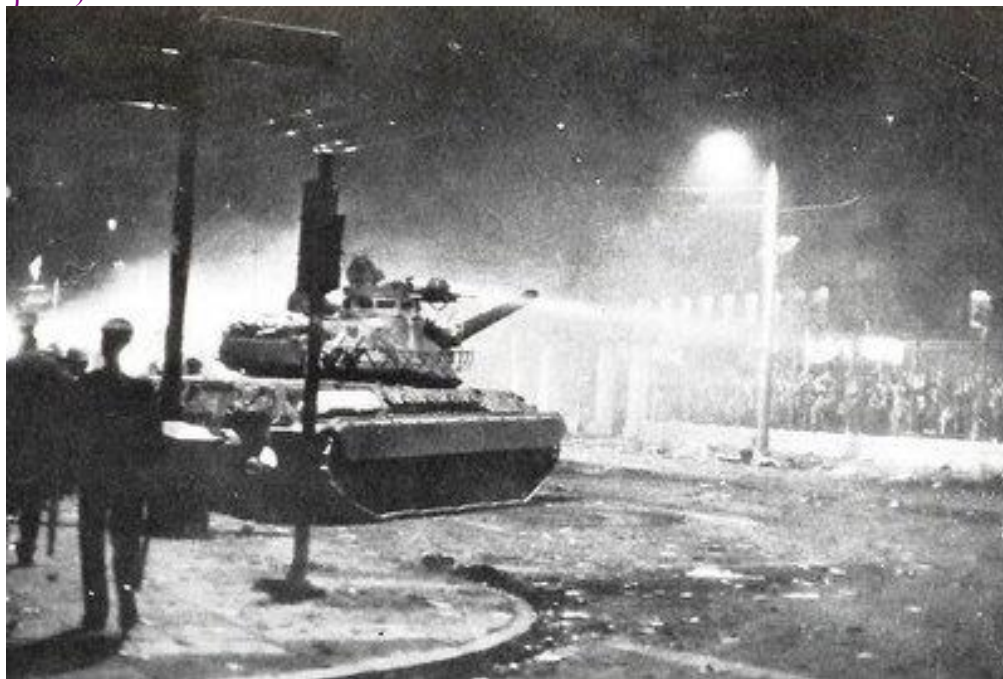
Τанк у ворот Политехнического института

Η στρατιωτική δικτατορία της 21 ης Απριλίου 1967, με όλα τα δεινά που επέφερε στην Ελλάδα, με κορύφωση το διαμελισμό της Κύπρου, αποτελεί ακραίο σύμπτωμα και νομοτελειακή κατάληξη της εσωτερικής οργανικής αδυναμίας του μεταπολεμικού ελληνικού δημοκρατικού πολιτεύματος. Μετά την αποκατάσταση της Δημοκρατίας στη χώρα (24 Ιουλίου 1974), η μεταδιδασκτορική πολιτική ηγεσία θέτει ως πρώτο στόχο της εδραίωση της δημοκρατίας στην Ελλάδα και την εξάλειψη και επούλωση των τραυματικών εμπειριών του εμφυλίου πολέμου. Σταθμούς σε αυτή την πορεία αποτελούν η νομιμοποίηση του Κομμουνιστικού Κόμματος Ελλάδος - Κ.Κ.Ε. (κυβέρνηση Καραμανλή), η διενέργεια δημοψηφίσματος (8 Δεκεμβρίου 1974) και η εγκαθίδρυση της προεδρικής δημοκρατίας (κυβέρνηση Κωνσταντίνου Καραμανλή), η ψήφιση του νέου συντάγματος (9 Ιουνίου 1975, κυβέρνηση Κωνσταντίνου Καραμανλή, σύμφωνα με το οποίο πρώτος πρόεδρος της Ελληνικής Δημοκρατίας εκλέγεται ο Κωνσταντίνος Τσάτσος [1975-1980] και δεύτερος ο Κωνσταντίνος Καραμανλής [1980-1985]) και ο νόμος για την αναγνώριση της Εθνικής Αντίστασης (1982, κυβέρνηση Ανδρέα Παπανδρέου).