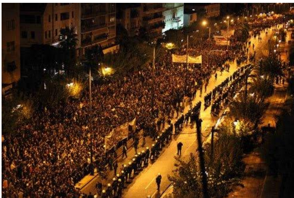
Демонстрация против режима черных полковников

Лозунги, которые звучали в течение всех трех дней восстания ("сегодня умирает фашизм", "рабочие, крестьяне, студенты", "долой американцев", "долой НАТО", "хлеба, образования, свободы"), выражали народные требования и призывали всю греческую нацию подняться на борьбу с черными полковниками. Были и политические призывы: выход страны из международных военно-политических блоков и организаций, обретение подлинной национальной независимости, предоставление всем гражданам права на свободу, работу и образование.