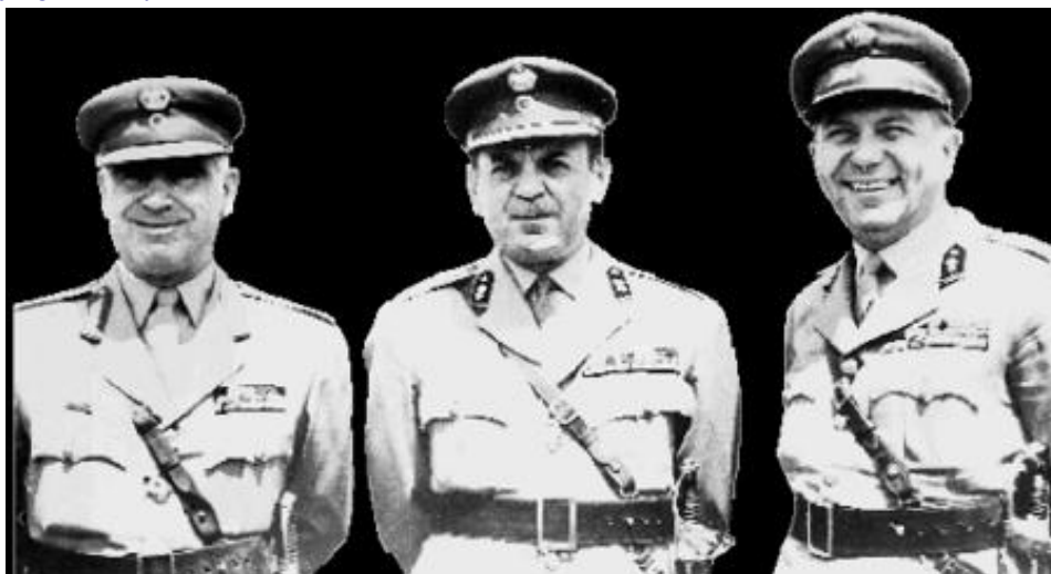
Предводители хунты: Стилианос Паттакос, Георгиос Пападопулос и Николаос Макарезос

После победы на выборах в ноябре 1963 г. премьер-министром страны стал центрист Георгиос Папандреу. Это дало повод двору вмешаться в политическую жизнь страны, в результате чего 15 июля 1965 г. Папандреу был отстранен от должности королем. Следующие полтора года характеризуются правительственной чехардой. В этом проявляется слабость двора, которому не удается создать дееспособный кабинет. В результате 21 апреля 1967 г. произошел государственный переворот и к власти пришли черные полковники.